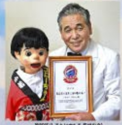
長崎市長(左)と市長(右)

お子様へのミニ凧の無料配布ほか、 長崎の伝統芸能「龍(じゃ)踊り」、 長崎の物産の販売もあります。